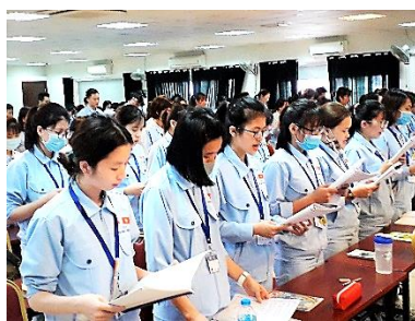
↑ 日本語の歌を練習中。中には歌手のように上手な人も…。

社会文化適応研修は通常の授業と異なり、4〜5クラス合同で行われます。70〜80人の候補者が広い教室に集まり、日本人講師とベトナム人講師が協力して授業を進めていきます。動画や写真をふんだんに使い、時には実物も用いて日本の雰囲気が感じられるよう工夫をしています。また、授業では毎回日本の歌も練習します。歌の時間を楽しみに行っている候補者もいれば、日本的な音階やリズムに四苦八苦しながらんばっている候補者もいるようです。