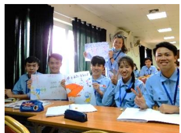
↑ 「病気の予防」の授業

社会文化適応研修ではこのほかにも「日本の冠婚葬祭」や「ごみの分別・リサイクル」、「食事のマナー・食習慣」などを勉強します。書道やゆかたの着付けなど、文化体験も予定されています。