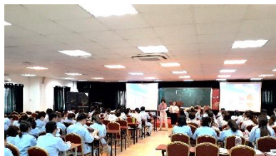
↑ 社会文化適応研修の様子

候補者は日本で、看護や介護の現場で働くこととなります。職場のマナーや仕事への意識など、ベトナムとは異なる環境になじみ、そこで活躍していかなければなりません。また、社会規範や生活スタイルにも大きな違いがあります。彼らが日本での生活に適応できるよう、1年間の研修の中では、日本語だけでなく日本社会や習慣についても学習していきます。その中心的な役割を担っているのが「社会文化適応研修」です。